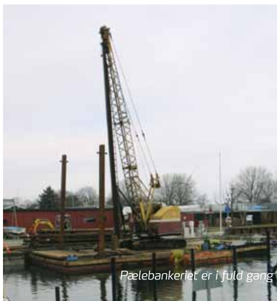
Pælebankeriet er i fuld gang

Alt imens vi stadig venter på EU's fastlæggelse af en fælleseuropæisk vurdering af de biocidaktive stoffer i bundmalingen, er den midlertidige ordning om brugen af denne maling forlænget i 3 år med udløb 1. januar 2018. Læs hele indlægget i Dansk Sejlunionions nyeste udgave af "SEJLER".