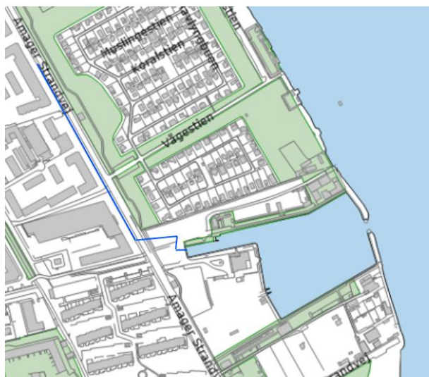
Regnvandsledning og udledningspunkt til Sundby Sejlforenings Havn

Vi har derfor allerede gravet en regnvandsledning ned langs Amager Strandvej. Efter grundige analyser samt møder med sejlforeningen, er det videre besluttet, at udløbet til havet skal ske fra havnebassinet i Sundby Sejlforenings Havn. Se strækningen på nedenstående kort: